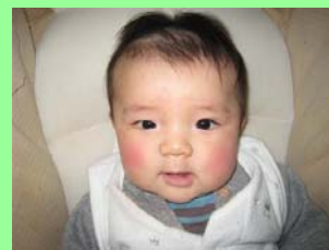
特別参加のお寺の赤ちゃん 可愛がって下さり大感謝です!

もう一度みんなで一緒に歌を 歌って、笑って、最後まで 盛り上がりましたね♪ 『ももたろさん』『もしもしカメよ』は難しいです。。 また次回をお楽しみに♪